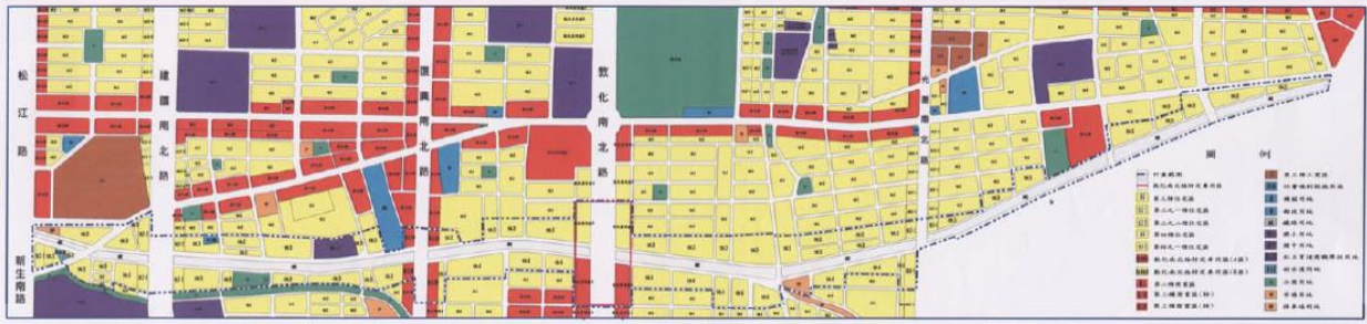
圖一 市民大道(新生北路至基隆路段)都市計畫現況示意圖